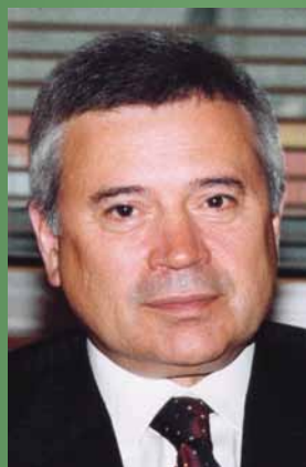
АЛЕКПЕРОВ ВАГИТ ЮСУФОВИЧ Президент ОАО «ЛУКОЙЛ»

ОАО «ЛУКОЙЛ» – одна из крупнейших международных энергетических компаний. Основные виды деятельности – разведка и разработка месторождений нефти и газа, производство и реализация нефтепродуктов, нефтехимической продукции и электроэнергии. На предприятиях Группы «ЛУКОЙЛ» трудится около 150 тыс. человек. Компания работает в 60 регионах России и более чем 40 зарубежных странах. В структуру компании входят 9 нефтеперерабатывающих заводов. Сбытовая сеть ЛУКОЙЛа превышает 6,7 тыс АЗС и охватывает 46 регионов РФ, 25 стран Европы, Балтии и СНГ, а также 13 штатов США.